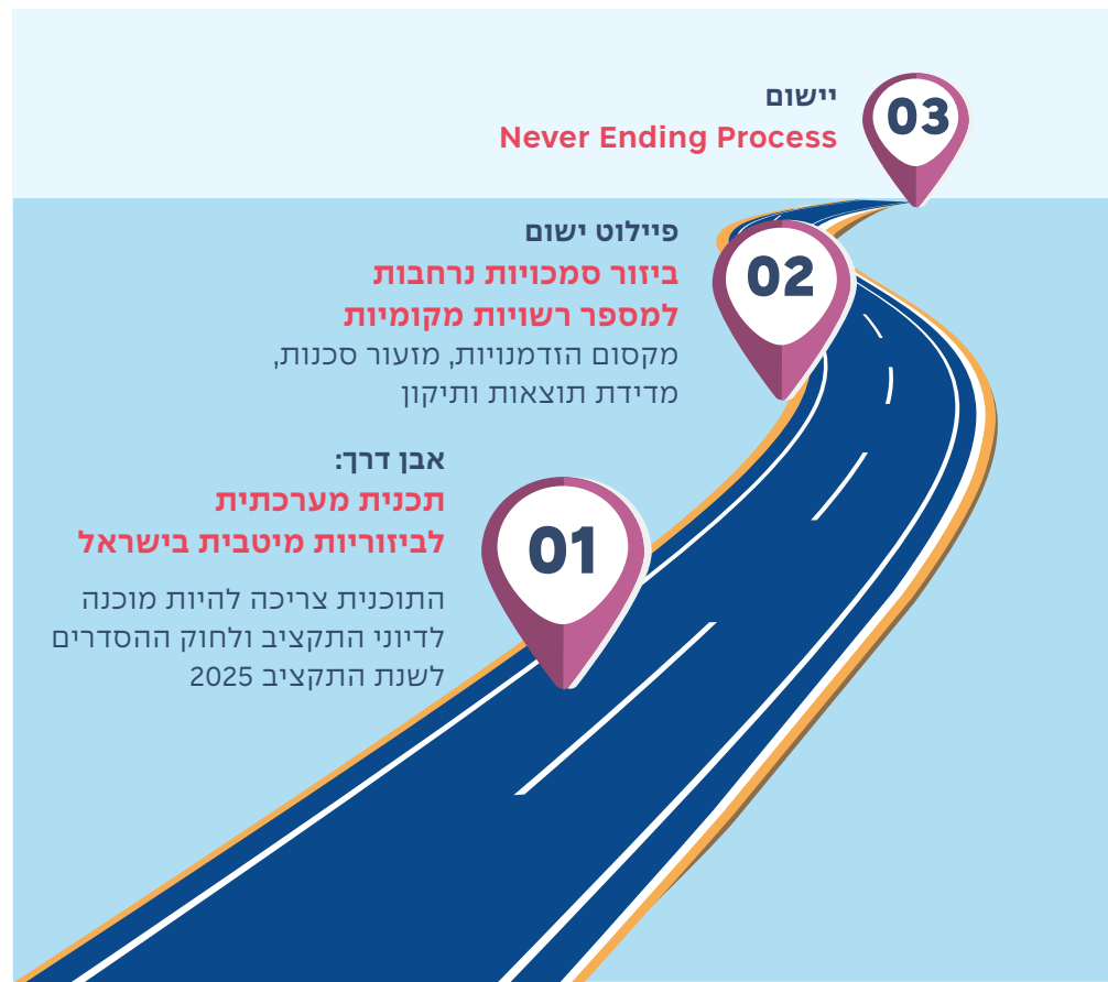
תרשים ה': אבני הדרך הגדולות, ראשוני

ניתן לאפיון באופן ראשוני את אבני הדרך המרכזיות באופן הבא: