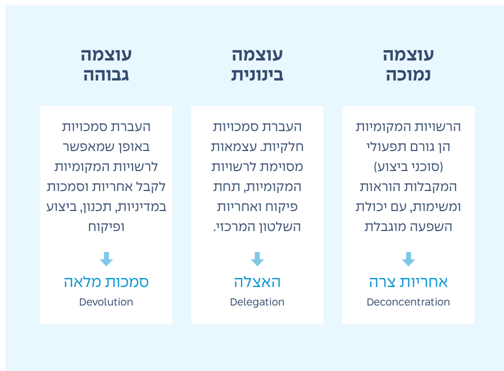
תרשים ג': מאזן מחדש של אחריות משותפת

לרשויות המקומיות, והן משמשות כגורם ביצועי תפעולי, בעלות יכולת השפעה מוגבלת. ניתן לומר שזוהי מערכת היחסים בין השלטון המרכזי למקומי בישראל נכון לשנת 2023 למעט מספר ערים חזקות וגדולות המתפקדות באופן עצמאי יותר. העוצמה הבינונית של ביזור ('האצלה') מבטאת מערכת יחסים מאוזנת יותר בה מואצלות סמכויות לרשויות המקומיות, לפי החלטת השלטון המרכזי. ההאצלה מעניקה מידה מסוימת של עצמאות וגמישות לרשויות, אך עם זאת הן עדיין נתונות לפיקוח ואחריות ממשלתית. במקרה של האצלה, השלטון המרכזי יכול להחזיר לידיה את הסמכויות בכל עת. המצב המתקדם ביותר של ביזור הוא 'העברת סמכויות מלאה' לרשויות המקומיות, באופן שמאפשר להן חוקית לפעול כיחידות עצמאיות בעלות סמכות ואחריות על תחומי מדיניות מסוימים. החקיקה היא המסגרת המשפטית שמגדירה באופן ברור את תחומי האחריות, הזכויות והחובות של הרשויות המקומיות, לשם יצירת איזונים ובלמים. במסגרת של ביזור מלא נדרשים גם מנגנוני הגנה על מסגרת הניהול הפיננסי, שיאפשרו לרשויות המקומיות עצמאות ויציבות כלכלית במסגרת שקופה ואחראית.