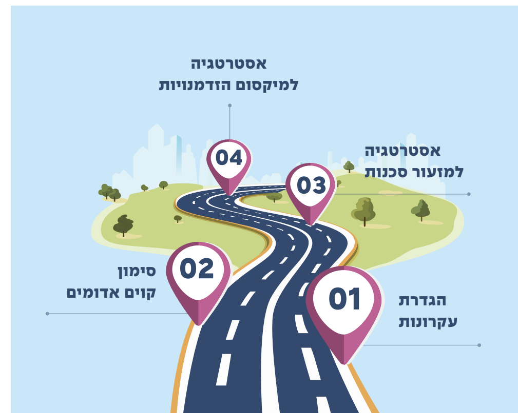
תרשים ד': תהליך גיבוש המצפן

'מצפן ביזור' היא מתודה אפשרית שפותחה על ידי ג'וינט-אלכא ומלגת בכר עבור משרדי הממשלה המעוניינים בתהליך ביזור, וכוללת ארבעה שלבים מרכזיים אשר מוצע להשקיע בהם זמן לחשיבה משותפת כחלק מגיבוש תוכנית מערכתית לביזור, בשיתוף עם הרשויות המקומיות. השלב הראשון כולל הגדרת עקרונות לביזור, לאחר מכן סימון קווים אדומים לביזור באמצעות הגדרת מוצרים ציבוריים לאומיים ואזוריים, השלב השלישי כולל מיפוי סכנות וגיבוש אסטרטגיות למזעור הסכנות, והשלב הרביעי כולל מיפוי ההזדמנויות וגיבוש אסטרטגיות למיקסום ההזדמנויות.