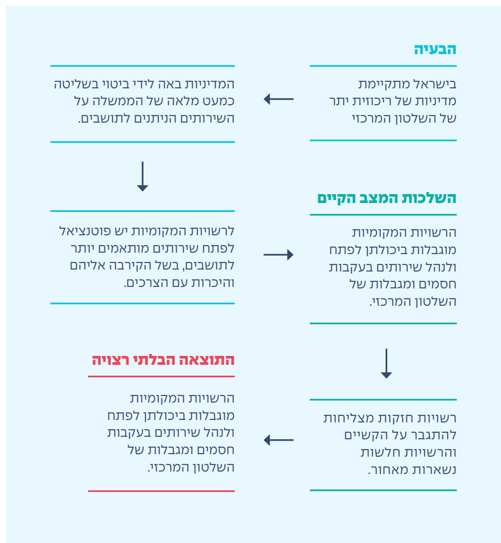
תרשים א': בעיית הריכוזיות בישראל

כוח אדם מיומן, קשרים אישיים עם בכירים בממשלה, ויותר כספים שהם יכולים לעשות בהם שימוש לטובת התושבים. לעומתם, הרשויות החלשות ברובן אינן מצליחות להתמודד עם הקושי ונשארות מאחור. וכתוצאה מכך דווקא האוכלוסיות הפגיעות ביותר מקבלות את השירותים הגרועים ביותר (תרשים א').