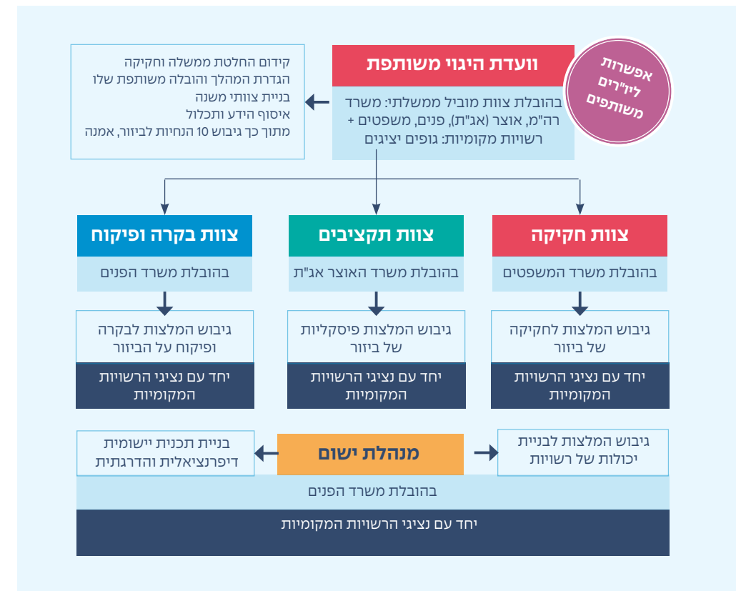
תרשים ד': אפיון ראשוני של תכנית מערכתית לביזור

במקביל לעבודת המטה מוצע להקים מינהלת יישום, שתגבש המלצות לבניית יכולות ברשויות המקומיות וכן, תבנה תכנית יישומית דיפרנציאלית והדרגתית להטמעת הביזור. מוצע כי מינהלת היישום תובל על ידי משרד הפנים ובשותפות עם נציגי הרשויות המקומיות.